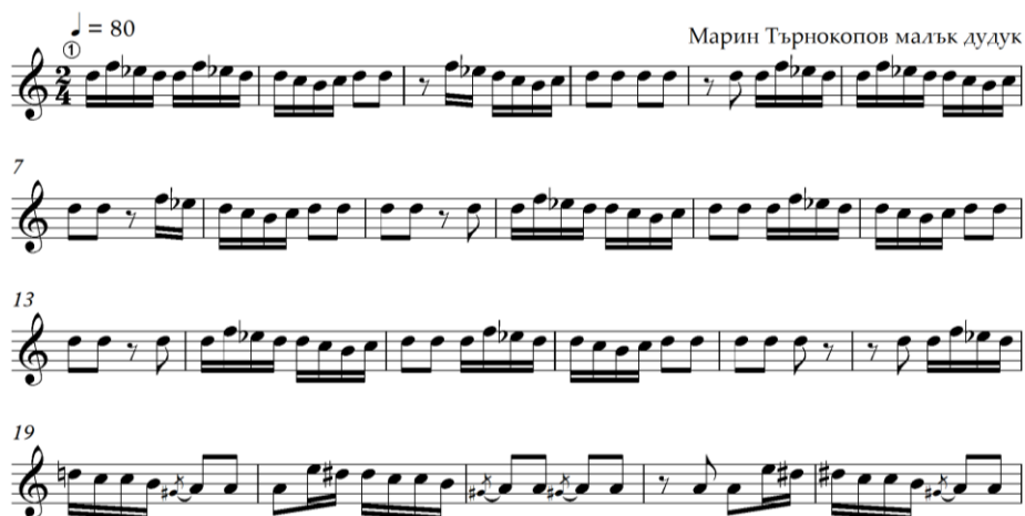
Fig. 2. Fragment of Kalushari dance, performed by Marin Gunev Tarvokopov (Tufa) (b.1925) (duduk), village of Milkovitsa, Pleven region (rec. Z. Mikova, December 1992, personal archive, Микова 2019 : 268-269).

Of interest to me as an ethnomusicologist is the musical accompaniment of the Kalushari dances. Some of the most valuable audio documents I have recorded from the Milkovitsa field are the two recordings that soundtrack the dances of the groups not only in the village of Milkovitsa, but also in the neighbouring settlements. The first musical recording is of Marin Gunev Tarnokopov (Tufa), which I recorded in 1992, performing on a wooden pipe. It was also the first tune the instrumentalist performed during our interview. (see Fig. 2.)