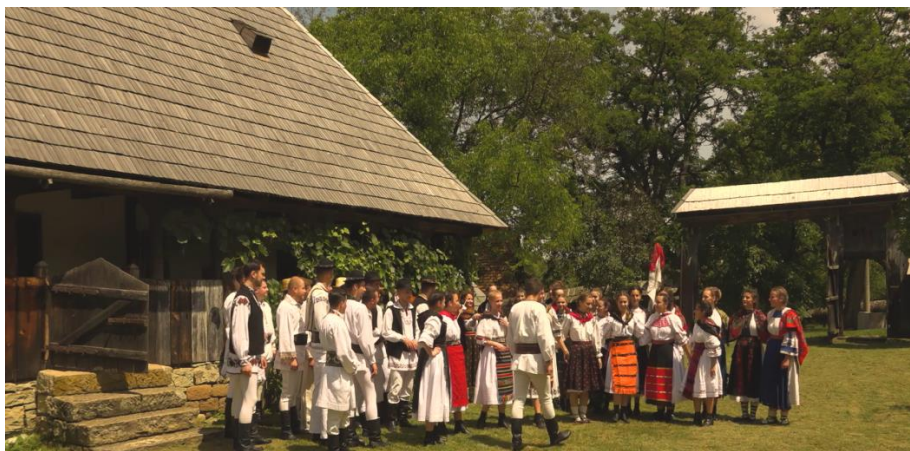
Fig. 9. Image from the show in the Ethnographic Museum of Transylvania, Cluj-Napoca

In order to favor a natural interpretation and at the same time to be able to recreate as closely as possible the atmosphere of the traditional village, unconventional and different scenic spaces were chosen for the performance, such as the “Lucian Blaga” Memorial House in Lancrăm, the Ethnographic Museum of Transylvania (open-air section) from Cluj-Napoca (fig. 9), the Găbud Monastery, Alba county (fig. 10), the Astra open-air museum from Sibiu (fig. 11).