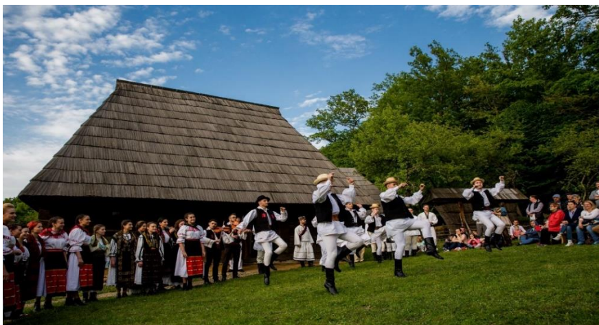
Fig. 11. Imagine din spectacolul de la Muzeul Astra, Sibiu