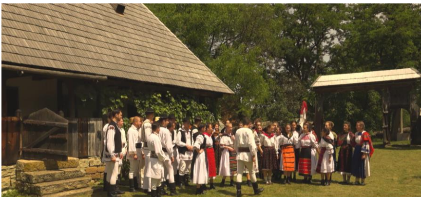
Fig. 9. Imagine de la spectacolul din Muzeul etnografic al Transilvaniei, Cluj-Napoca