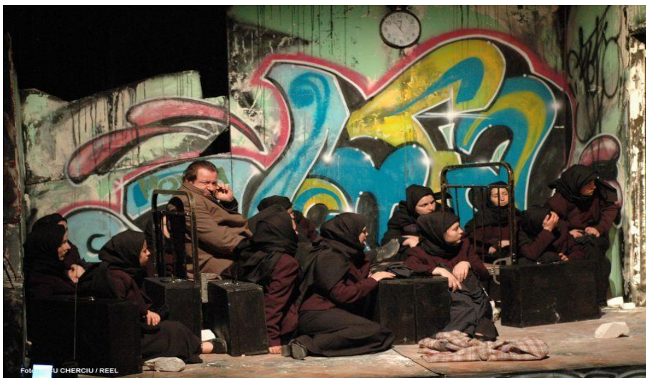
Fig. 2. Image from the performance The Banquet or the Road to Momfa , with the group of mourners

In 2010, on the occasion of the Ensemble's anniversary concert, at Casa Universitarilor, in Cluj-Napoca, as a director, I tried to introduce some elements to "dress up" the performance, such as the installation of mobile light spots with different colored filters depending on the moment depicted, to potentiate the emotional state in accordance with the ritual song performed; selecting costumes and accessories as traditional as possible; adopting a more natural body position and abandoning the position of overlapping arms in front of the abdomen.