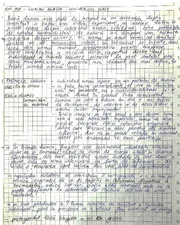
Fig. 6. Image from the director's notebook regarding the documentation on Lucian Bлага's poetry

Based on the documentation, I built the show around the fundamental theme that emerges from Lucian Bлага's poetry, namely that of the relationship between the individual self and the great universe . On the one hand, the world is given as a fully constituted whole and dependent on a higher order, and on the other hand there is the human subject who oscillates between contradictory options, likely to clarify or cloud the image of the universe. In the performance, I have narrowed this issue of Bлага's poetry from universal laws to the laws of traditional Romanian village life, so that individual experiences are manifested by relating them to the specific events imposed by village life, or in other words, to the "thresholds" of man's passage through life.