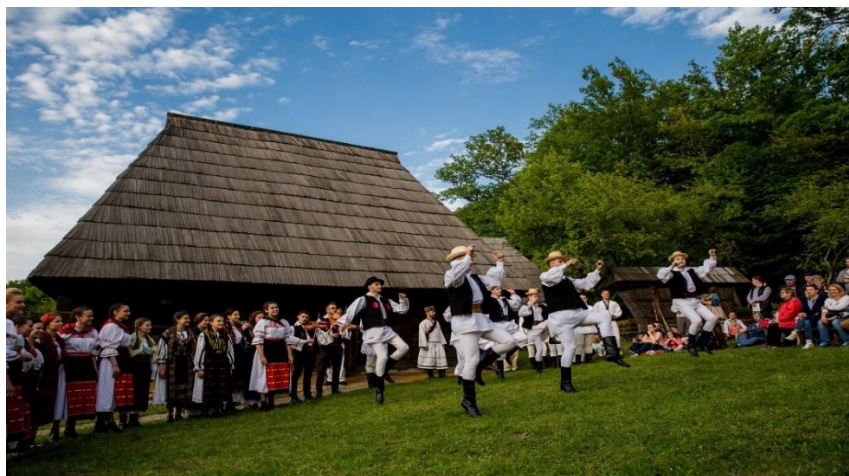
Fig. 11. Image from the show at the Astra Museum, Sibiu

In 2018, based on the script, the film Romanian Soul. Now and then was made, directed by Viorel Costea.