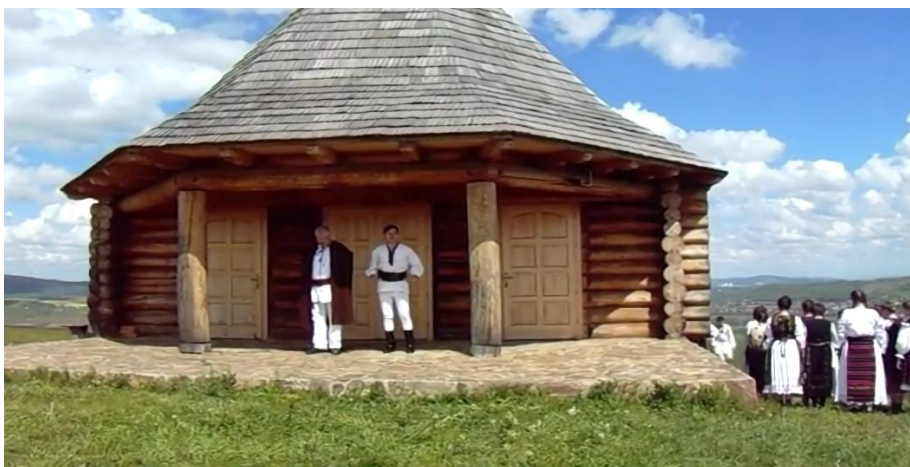
Fig. 10. Image from the performance at Găbud Monastery, Alba County