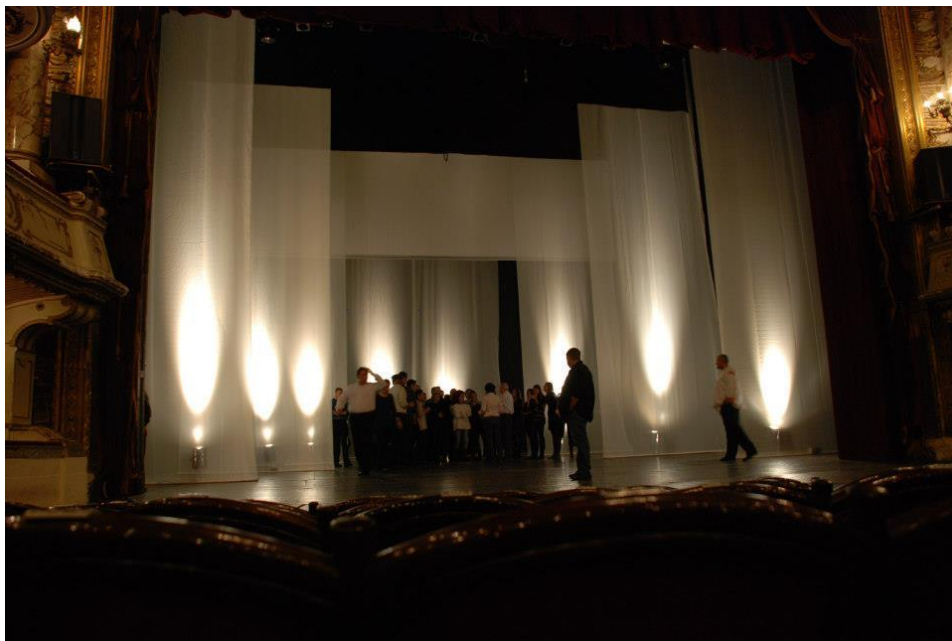
Figura 3. Pantalonii scenici, în scenografia lui Valentin Codoiu

Scenograful Valentin Codoiu a realizat o scenografie aparent simplă dar foarte ingenioasă, folosind doar câteva perechi de pantaloni alb-transparenți (fig. 3), cum se numesc în terminologia scenică românească, cu ajutorul cărora s-a creat imaginea de perspectivă. Apoi au fost proiectate imagini (reprezentând poze vechi) aferente momentului muzical înfățișat. Astfel, senzația vizuală creată era aceea de pătrundere și de întrepătrundere a interpreților în imaginile proiectate (fig.4).