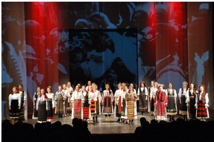
Fig. 4. Stage pants with image projection, scenography by Valentin Codoiu

Regarding the arrangement of the members of the Ensemble in space, different movements were designed to be in accordance with the moment presented, and a small documentation was made on how these events were carried out in the traditional Romanian village. For example, for the song Liora , which is a song of “twinning” of the girls, we followed the stage transposition of the movements as we found it in the description of the game from the book named Musical Folklore from Bihor by Traian Mîrza, in which, next to the score, the following observation appears: “from the group of girls two rows are formed - a larger row with two players in front, or pairs in a row, which pass under the “gate” raised (by joining hands) by a pair in front, etc., a situation in which those from the smaller group have the possibility to choose, “each the one they like” from the larger group” (Mîrza, 1974: 95). In the performance were created three gates made by pairs of girls holding together a veil (the veil was used as a symbol throughout the whole performance, changing its meaning depending on the moment – at birth it signifies the child in the mother’s arms, at the wedding it means the bride’s veil, etc.), and two performers passed through these gates one by one. You can view the moment by scanning the QR code (fig.5):