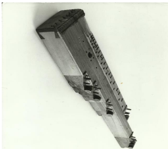
Fig. 2. Țiteră cu capete laterale