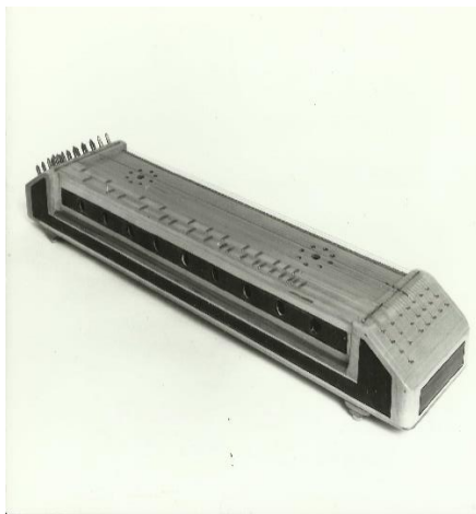
Fig. 1. Țiteră tip jgheab

Aceasta este sculptată dintr-o singură bucată de lemn. Are formă lungă și îngustă, lipsesc capurile (ornamentele) laterale, și are fundul deschis. Probabil acest tip a fost prima variantă a țiterii maghiare.