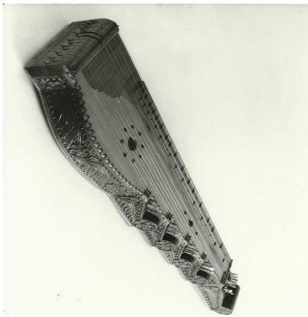
Fig. 3. Țiteră cu pântece