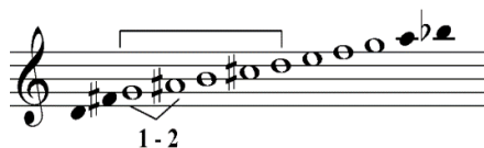
Fig. 1. Scara cromatică

Constantin Brăiloiu este cel care semnaleză prezența pentatoniei în muzica instrumentală; acesta dezvoltă o teorie a pentatoniei consonantice care pornește de la prima serie a scării pentatonice corespunzătoare modului I al chinezilor și formează cinci serii care au ca punct de plecare un sunet generator - sol.