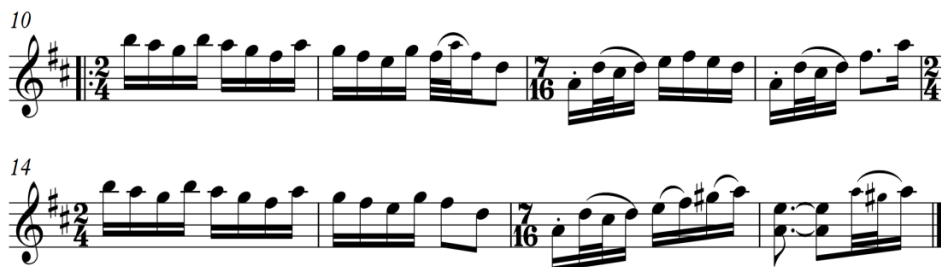
Fig. 2. Pre loc (Bartók, 1976: 23)