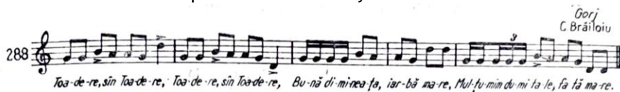
Fig. 5. The song Toadere, Sântoadere (Comișel, 1967: no. 288:213)