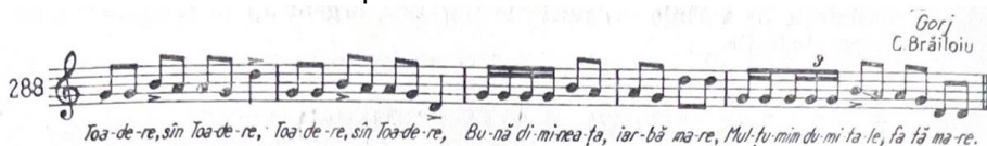
Fig. 5. Melodia Toadere, Sân Toadere (Comișel, 1967: nr. 288:213)